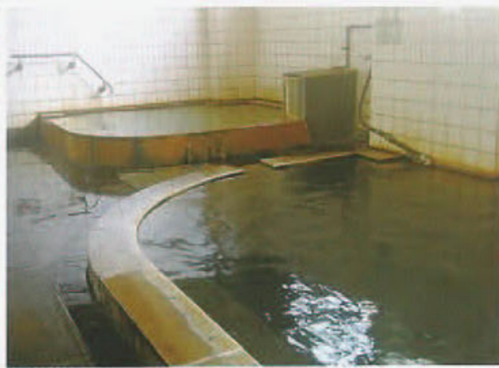
女性大浴場“やすらぎの湯”