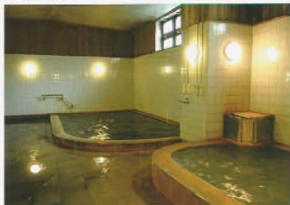
男性大浴場“太古の湯”