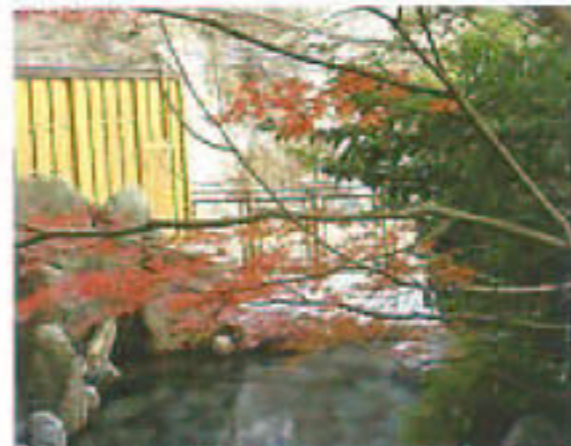
露天風呂「もみじの湯」

塩原は源泉の数も豊富で、泉質も様々です。姉妹館彩つむぎもご利用なごつて、温泉三昧を心ゆくまでお楽しみください。