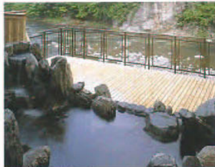
女性露天風呂「やしお」