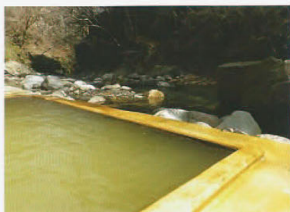
女性専用露天風呂