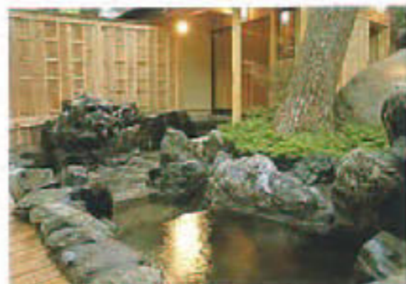
家族露天風呂「けやき」